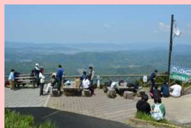
（生石高原山頂にて）