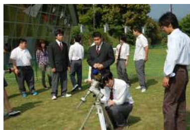
太陽のフレアと黒点の観察

5月27日(金) 2年生の地学の授業で、星の動物園、みさと天文台において現地学習をしました。天候にも恵まれ、太陽のフレアや黒点の観察をしました。そのほか彗星のお話、望遠鏡の構造等を天文台長の矢動丸先生より分かりやすく説明して頂きました。生徒たちも宇宙に思いをさせ、興味深く望遠鏡の中を覗き込んでいました。