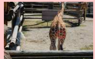
幸せを呼ぶ ハートマークの模様