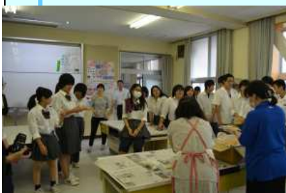
【アルファ米試食体験】